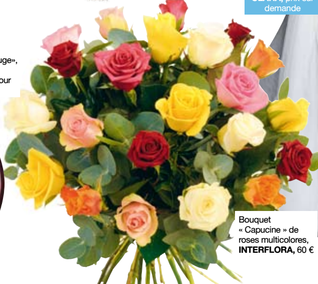
Bouquet « Capucine » de roses multicolores, INTERFLORA, 60 €