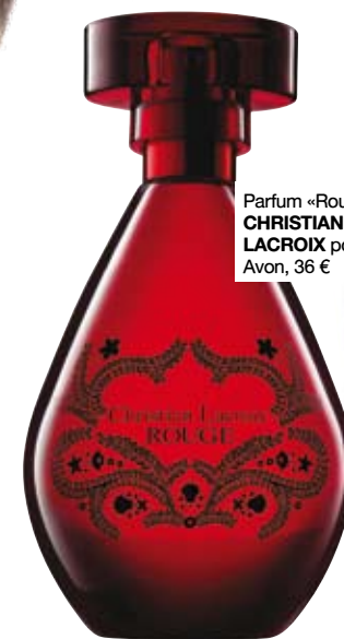
Parfum «Rouge», CHRISTIAN LACROIX pour Avon, 36 €