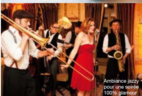
Ambiance jazzy pour une soirée 100% glamour