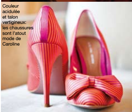
Couleur acidulée et talon vertigineux: les chaussures sont l'atout mode de Caroline