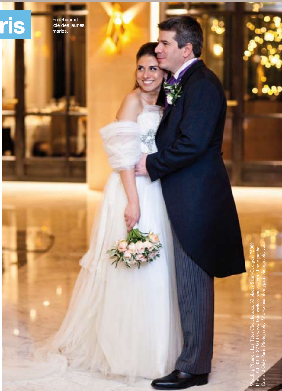
Wedding Planner: Les Têtes Chercheuses, 30 places Saint-Georges, 75009 Paris, Tél.: 01 43 87 90 15 www.les-tetes-chercheuses.com

LA CÉRÉMONIE Poétique. Il règne une chaleureuse ambiance dans l'église décorée de fleurs et de bougies. Un moment hors du temps dont le couple a savouré chaque minute. Pour accueillir et réchauffer les invités, un chocolat chaud leur est offert à