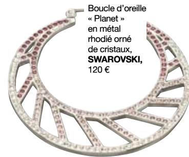
Boucle d'oreille « Planet » en métal rhodié orné de cristaux, SWAROVSKI, 120 €