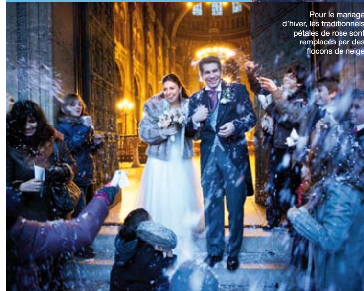
Pour le mariage d'hiver, les traditionnels pétales de rose sont remplacés par des flocons de neige

“ Mes souvenirs les plus chers de la journée : les moments partagés avec notre entourage et l'ambiance rétro qui a donné du cachet à la réception. ”