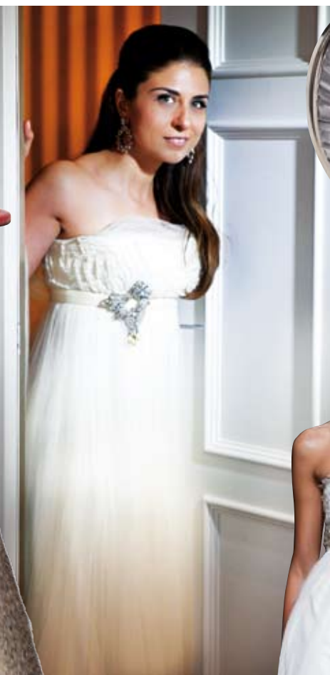
Robe bustier en organza et dentelle, ceinture à perles, ROSA CLARA, prix sur demande