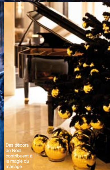
Des décors de Noël contribuent à la magie du mariage