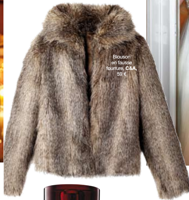
Blouson en fausse fourrure, C&A, 59 €