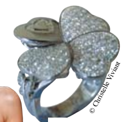
Bague «Trefflediam» en diamant, XAVIER DE FRAISSINETTE, à partir de 3500 €