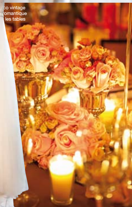
Bo vintage romantique des tables