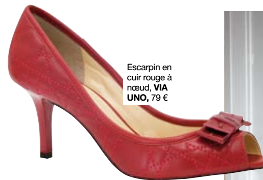
Escarpin en cuir rouge à nœud, VIA UNO, 79 €